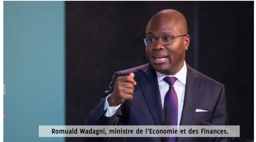
Romuald Wadagni, ministre de l'Économie et des Finances.

C'est déjà connu, le conseiller technique à l'Economie du président de l'Assemblée nationale, Gratien Ahouanmènou a informé le 31 octobre dernier, lors du séminaire d'appropriation par les députés des éléments d'analyses du projet de loi finances 2018, que le budget de l'Etat, exercice 2018, allait être revu à la baisse par rapport à l'exercice 2017, passant ainsi de plus de 2 010 milliards de F.Cfa à 1 862, 918 milliards de F.Cfa. Soit une baisse de plus de 147 milliards de F.Cfa