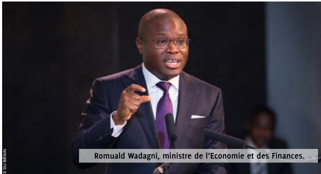
Romuald Wadagni, ministre de l'Economie et des Finances.

La suppression de plusieurs entités budgétivores parmi lesquelles le Haut-commissariat à la gouvernance concertée, la Cellule de contrôle de l'exécution des projets de développement, le Haut-commissariat à la solidarité nationale ! Vous savez, les