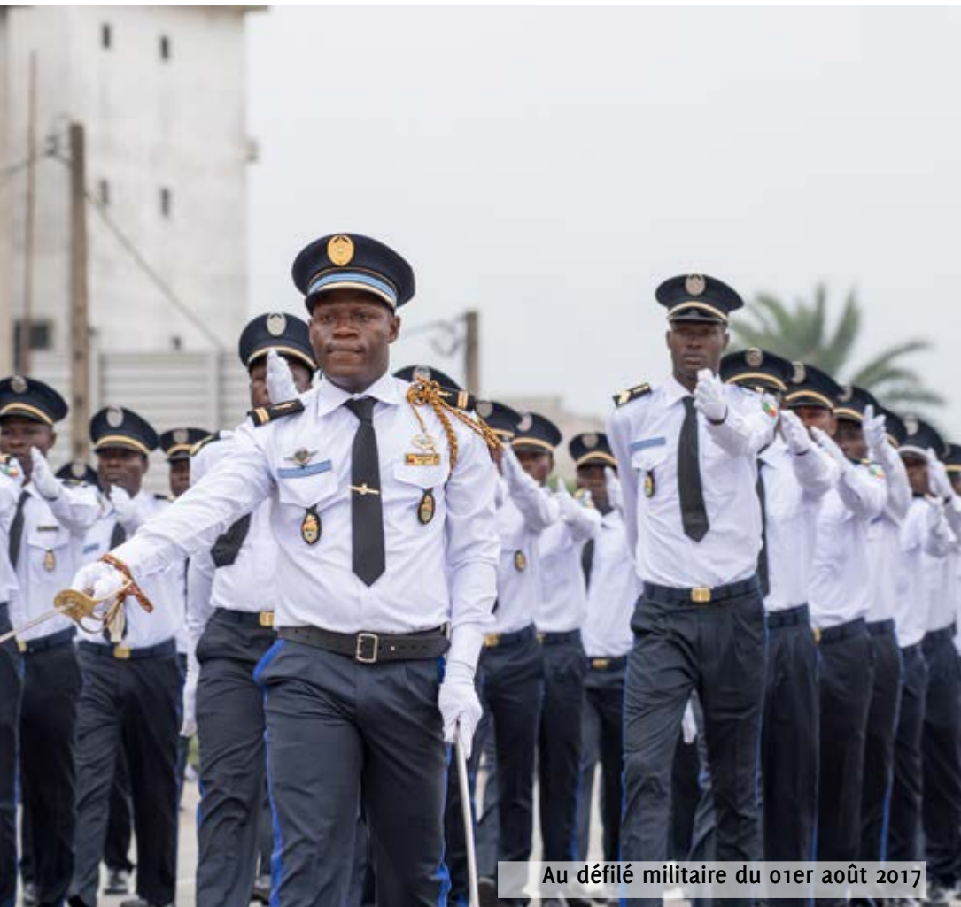
Au défilé militaire du 01er août 2017

« Au plan sécuritaire, il est important de signaler que des améliorations notables ont été relevées. Le gouvernement a donc entrepris dans ce domaine-là, des actions de renforcement du système de sécurité intérieure pour la protection des biens et des personnes par quelques actions importantes, clés, que je voudrais vous signaler. D'abord, une allocation directe des ressources financières, conséquente, aux unités de police et de gendarmerie qui met fin à une pratique incroyable qui existait. Celle de financer le fonctionnement de ces unités-là, le produit de rançonnement des populations.