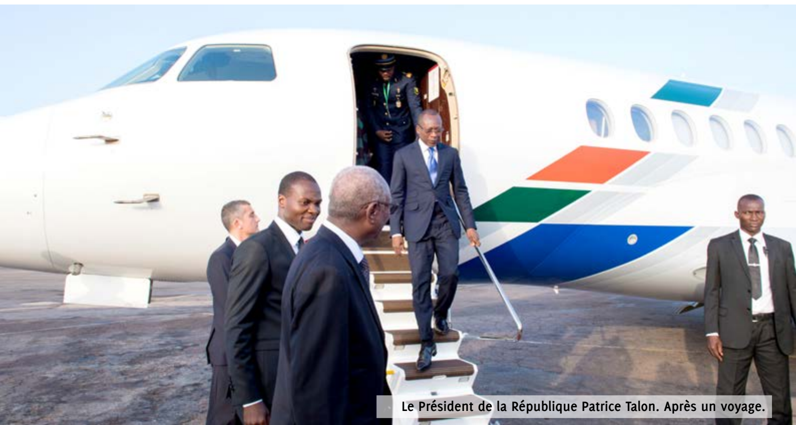
Le Président de la République Patrice Talon. Après un voyage.

« Je pense que j'ai pris fonction le 07 avril. Et entre le 07 et le 30 avril, j'ai eu peut-être trois propositions sérieuses de créer ma propre agence de voyage. C'est-à-dire qu'on me dit, "Romuald, il faut que tu crées toute de suite une agence de voyage". Alors moi, dès qu'on me fait une proposi-