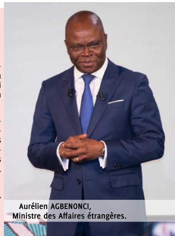
Aurélien AGBENONCI, Ministre des Affaires étrangères.

Explications d'Aurélien AGBENONCI, ministre des Affaires étrangères.