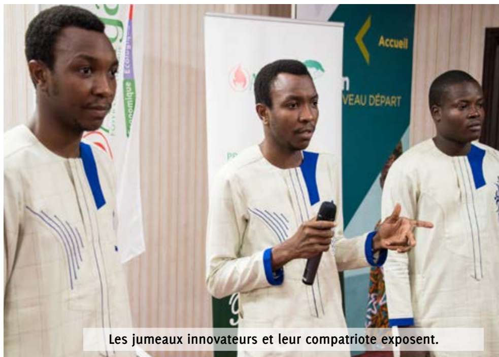
Les jumeaux innovateurs et leur compatriote exposent.

Ces foyers existent en plusieurs modèles (petit modèle pour un usage domestique, moyen pour les restaurants et commerces, et un modèle pour un usage industriel à grande échelle) avec des prix de vente variant entre 55.000 F.Cfa et