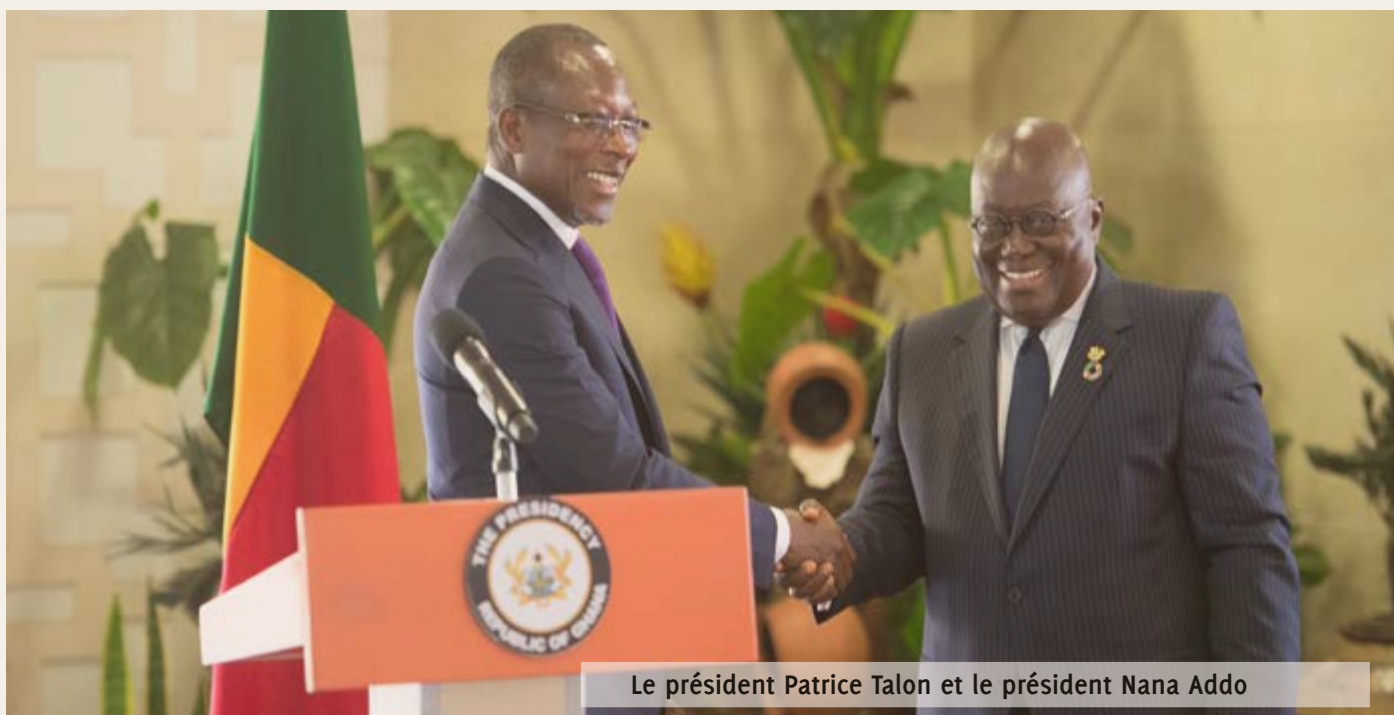
Le président Patrice Talon et le président Nana Addo

LE PRÉSIDENT BÉNINOIS ÉTAIT EN VISITE DE TRAVAIL LE MERCREDI 11 OCTOBRE 2017 À ACCRA, OÙ IL A ÉTÉ REÇU AU PALAIS PRÉSIDENTIEL « FLAGSTATE HOUSE » PAR SON HOMOLOGUE GHANÉEN. AU MENU DES ÉCHANGES AVEC NANA ADDO DANKWA AKUFO-ADDO, COOPÉRATION BILATÉRALE ET INTÉGRATION SOUS-RÉGIONALE.